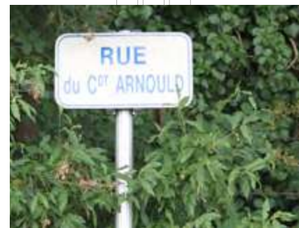
La rue du Commandant Arnould.

À propos de la guerre de 1870, on évoque souvent la bataille d'Auvours et celle du Mans. Mais qu'en est-il de celle de Chanteloup, hameau situé sur la commune de Sillé-le-Philippe ?