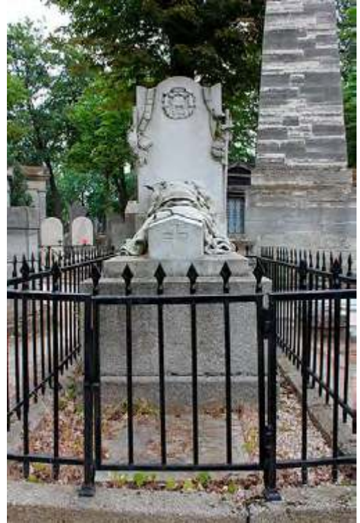
La tombe de Timbrune au Père Lachaise.

démoli en 1843. Il n'en reste que quelques vestiges.