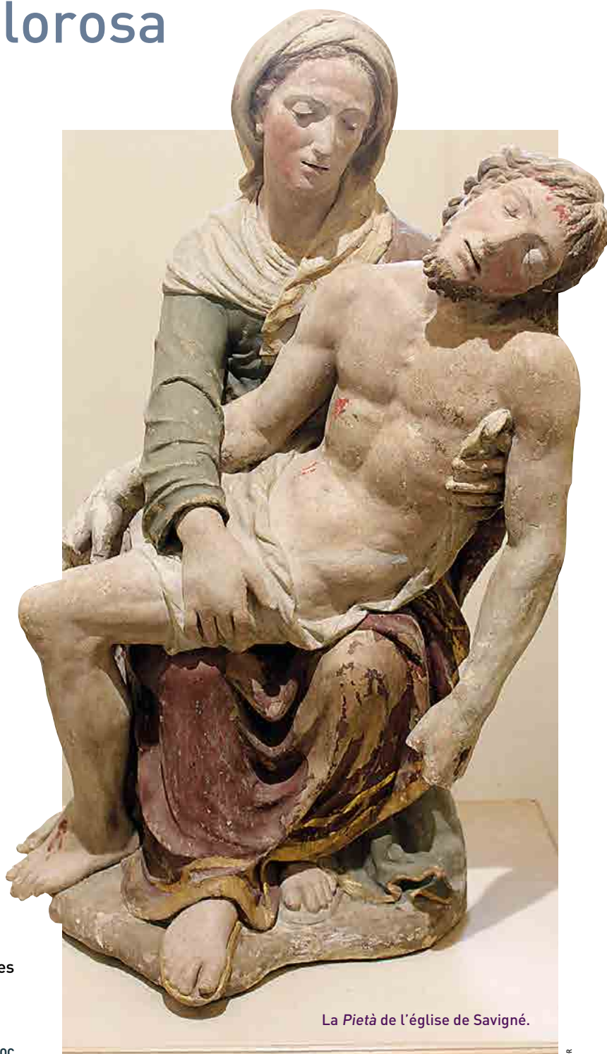
La Pietà de l'église de Savigné.